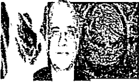
DIP. MANUEL AÑORVE BAÑOS Presidente GP-PRI