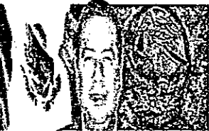
DIP. RICARDO MEJIA BERDEJA Titular GP-MC