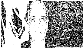
DIP. MANUEL AÑORVE BAÑOS Presidente GP-PRI