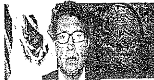
DIP. RICARDO MONREAL ÁVILA Titular GP-MC