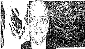
DIP. MANUEL AÑORVE BAÑOS Presidente GP-PRI