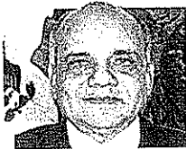
DIP. MANUEL AÑORVE BAÑOS Titular GP-PRI