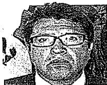
DIP. RICARDO MONREAL ÁVILA Titular GP-MOVIMIENTO CIUDADANO